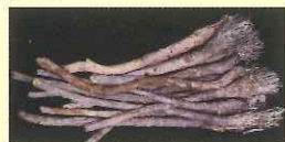
内モンゴル自治区 直営栽培基地