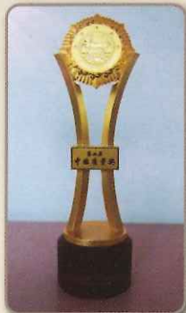
国家文化遺産 北京同仁堂 中成薬・漢方薬などの 中医薬分文化