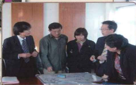
日水製薬と北京同仁堂 技術交流