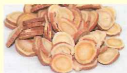
内モンゴル自治区 直営栽培基地