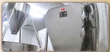
日水清心丸生薬混合工程