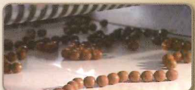
日水清心丸大蜜丸製造工程

北京同仁堂は、数百年の漢方薬の製造経験を持ち、この伝統的な製造方法は、中国政府より国家文化遺産に指定されています。また、最新の技術も併せ持ち、2015年には中国国家品質賞を受賞した唯一の医薬品製造メーカーです。