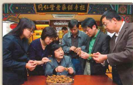
日水清心丸 生薬鑑定士

この「生薬の鑑定」や「化学分析」の合格をもって、はじめて日水清心丸の原料として使用することができます。