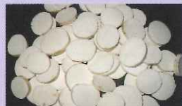
河南省 直営栽培基地