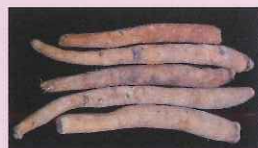
浙江省 直営栽培基地