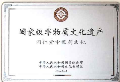
中国国家品質賞 北京同仁堂

北京同仁堂は、数百年の漢方薬の製造経験を持ち、この伝統的な製造方法は、中国政府より国家文化遺産に指定されています。また、最新の技術も併せ持ち、2015年には中国国家品質賞を受賞した唯一の医薬品製造メーカーです。