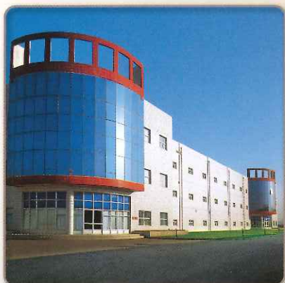
北京同仁堂 製造工場

「日水清心丸」は、日本向け専用の医薬品として、北京同仁堂の日本GMP 適合工場の専用ラインで製造されています。日本の医薬製造管理の基準及び品質管理基準に適合した医薬品です。日水清心丸は、大蜜丸という中国伝統的な製剤で、生薬の有効成分を余すことなく使用して製造されています。